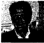
Santiago Calatrava spagnolo di Valencia