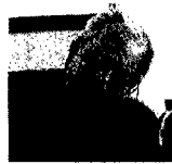
David Chipperfield la scuola londinese