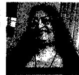
Zaha Hadid originaria di Baghdad